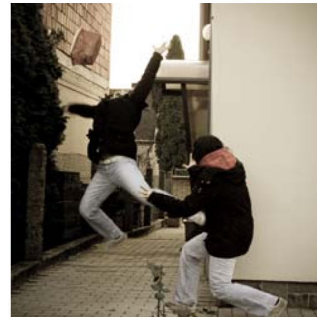
5. POHYBOVÁ SEKVENCE nazvaná Baf, kdy autorka vybafne na sebe samu a výsledkem je úlek a pád věcí... Někdy se stane, že člověk překvapí sám sebe, až se lekne...