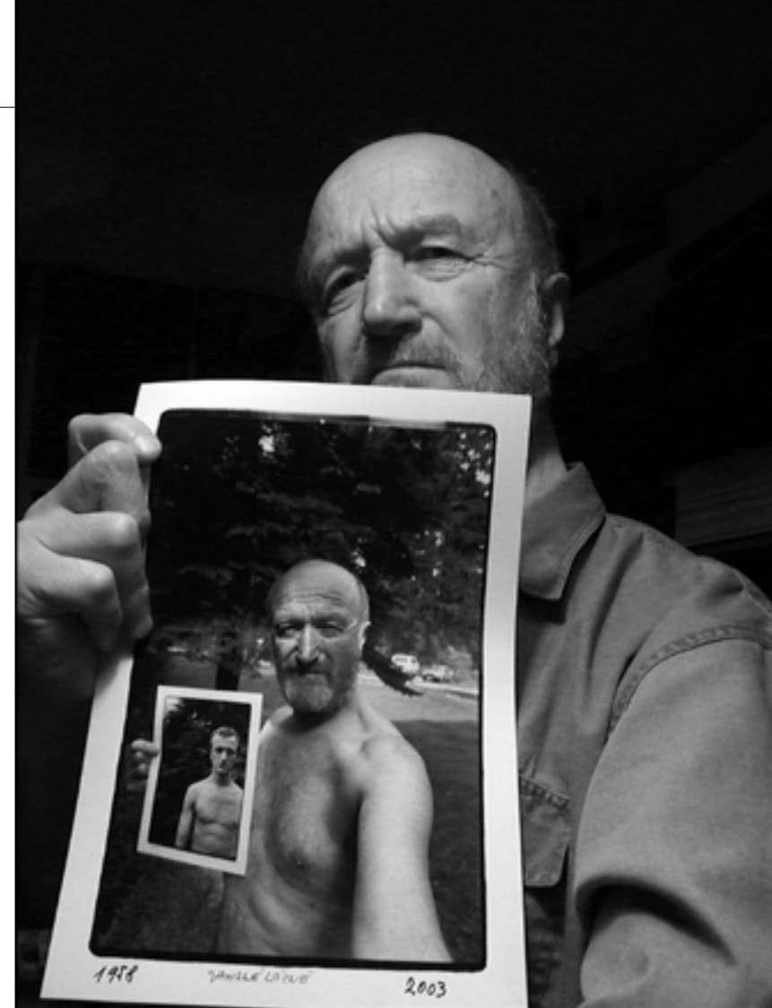
11. K NEJPŮSOBIVĚJŠÍM náleží autopořety znázorňující zároveň plynutí času...

(na autopořetu) vystudovala právnickou fakultu Univerzity Karlovy. Soustředí se na oblast autorského práva, pracuje již 19. rok ve společnosti Bonton, kde v průběhu let zajišťovala právní podporu hudebnímu vydavatelství, rozhlasové stanici, knižnímu vydavatelství i filmové distribuci. Působila též v ochranných a protipirátských organizacích.