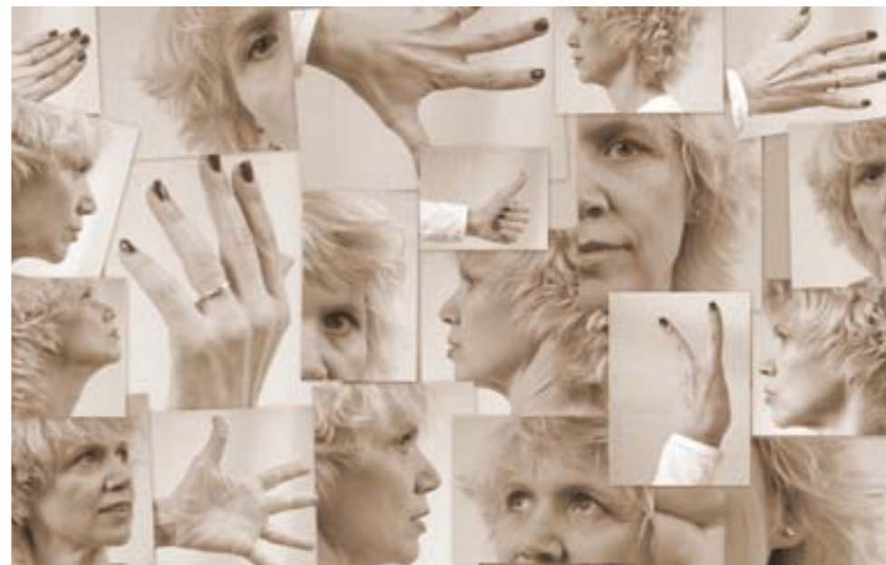
8. POUŽÍVÁNÍ DLOUHÝCH ČASŮ, pohybová neostrost, jiná barevnost, nekonvenčnost pohledu a výřezu – to vše vyjadřuje proměnlivost vzhledu a nemožnost vyjádřit jedním portrétem sebe sama. Autoportrét ze sledu snímků byl vytvořen v programu Picasa 3.