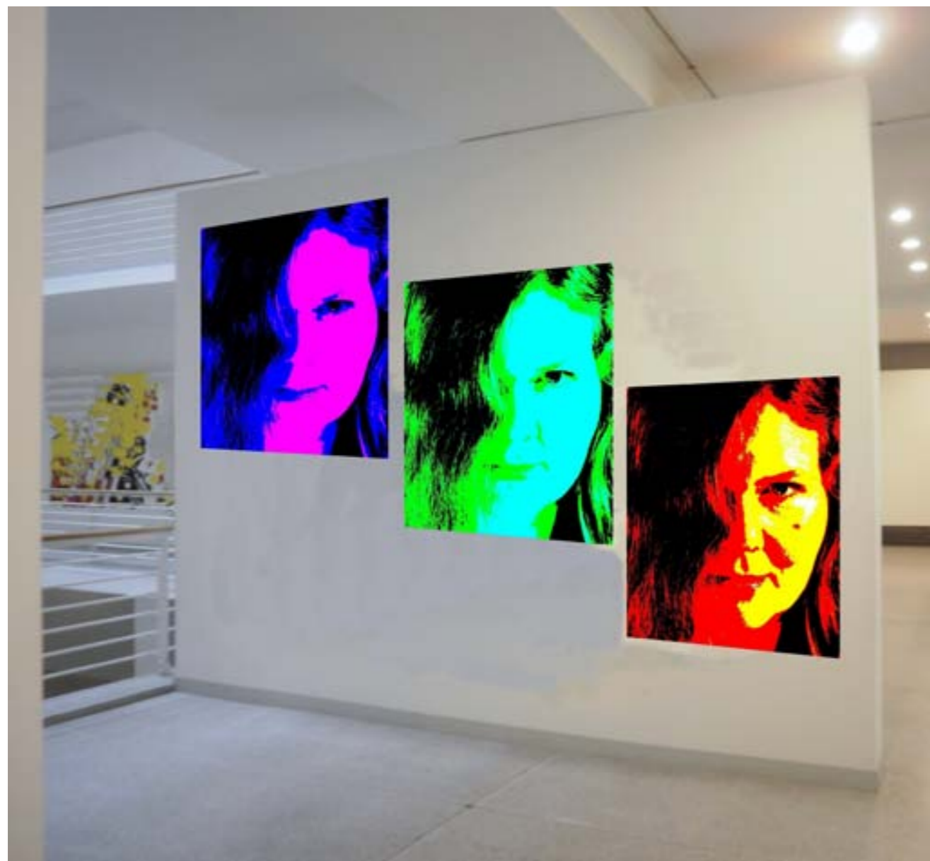
7. POČÍTAČOVÉ VARIACE svého autopotrétu autorka umístila do imaginární výstavní síně a nazvala je „à la Warhol“.

Autoportrét stylizující fotografa zvláštními technikami neslouží k popisnému svědectví o portrétovaném, ale je v zásadě jeho uměleckým přepisem, většinou s výrazným emotivním podtextem. V současné době vzniká mnoho autoportrétů pomocí zvláštních technik počítačového charakteru. Fotit může ostatně i „sám počítač“.