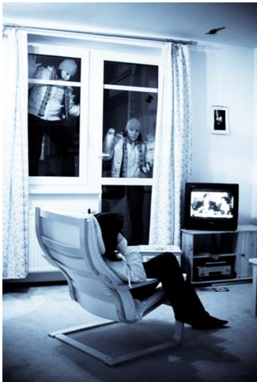
4. POKOJNÁ DIVAČKA TELEVIZE najednou spatří za oknem sebe samu, a to hned ve dvojnásobném vydání. Občas se to může stát, zejména v obrácené podobě, kdy se divák ztotožní s příběhem...

Vytvořit autoportrét pomocí vícenásobné expozice může být pro tvůrce nejen zábavnější, ale zároveň tak lze lépe vystihnout „poselství o sobě samém“. Může být i sondou do vlastního já, ale ze všeho nejvíc bude asi zábavnou hrou.