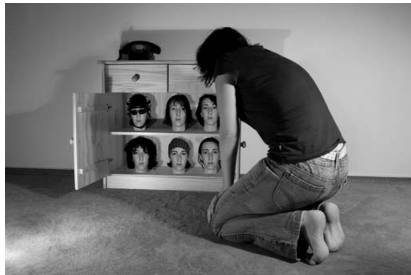
6. SURREALISTICKÉHO DUCHA má fotomontáž, na níž autorka rozpráví s různými podobami svého já. Otevře se skříňka a tam jsou... Každá s jinou hlavou, jiným účesem, jiným výrazem, ale pokaždé je to ona. Kterou si vybrat pro tento den?