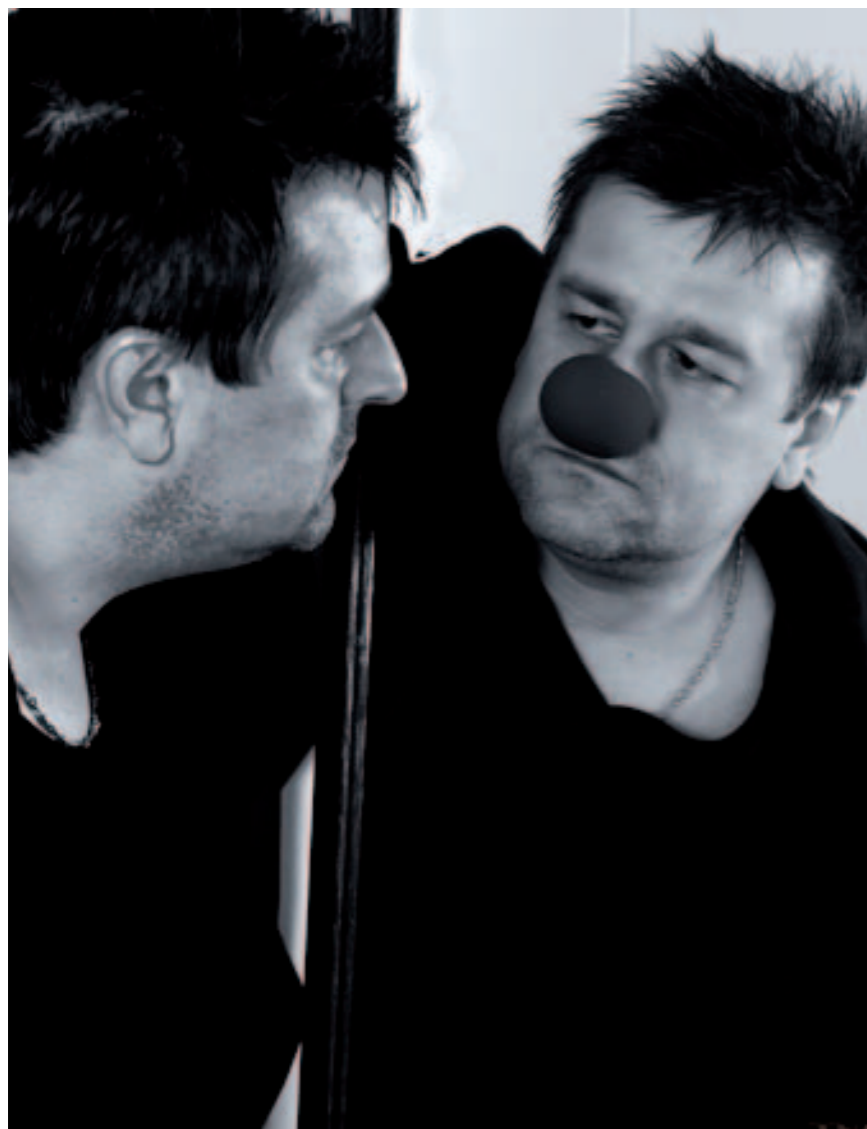
1. AUTOR SVŮJ AUTOPORTRÉT NAZVAL „PRAVDĚ DO OČÍ“. Je na divákovi, aby se zamyslel, jak snímek vznikl.

Vytvořit autoportrét jednou expozicí je nejčastější, protože je nejjednodušší. Doplnkový předmět u autoportrétu obvykle slouží k bližší charakteristice portrétovaného, který se přitom mnohdy opírá o jakousi zobrazovací tradici. Fotograf se tak často zobrazuje se samotným foťákem, malíř s paletou... Současnost od těchto klíšé ustupuje, ale různé atributy se u portrétů stále používají hojně.